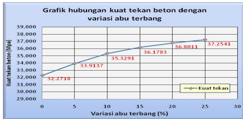
Gambar 4. Grafik hubungan antara kuat tekan beton normal dan beton dengan penggunaan abu terbang tanpa pengurangan semen