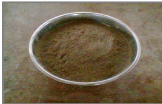
Gambar 1. Sampel Abu Terbang